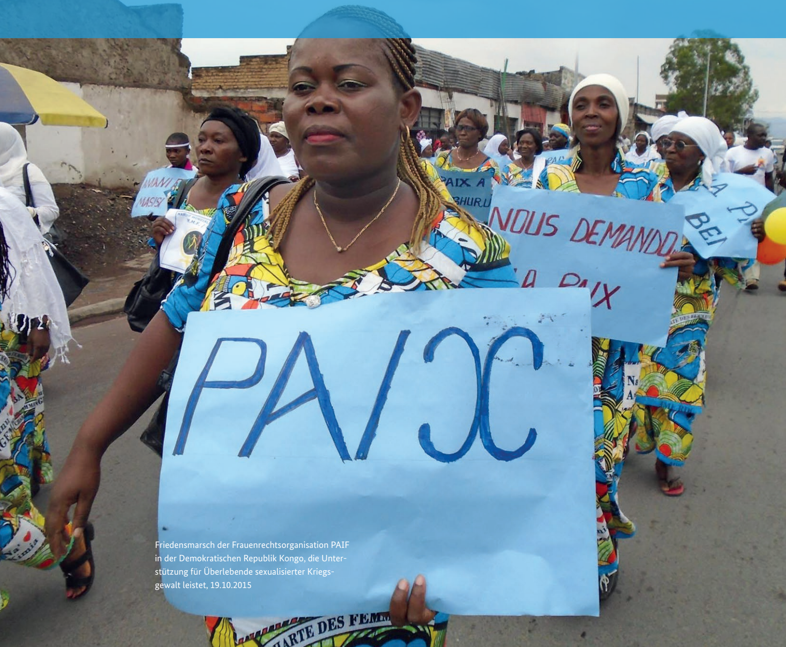
Friedensmarsch der Frauenrechtsorganisation PAIF in der Demokratischen Republik Kongo, die Unterstützung für Überlebende sexualisierter Kriegsgewalt leistet, 19.10.2015