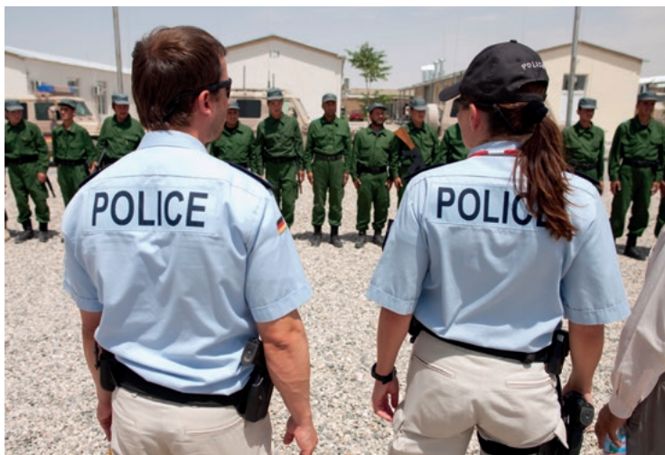
Police Training Center (PTC): Deutsche Polizistinnen und Polizisten bilden afghanische Polizisten aus, Masar-e-Sharif, Afghanistan, 02.06.2010