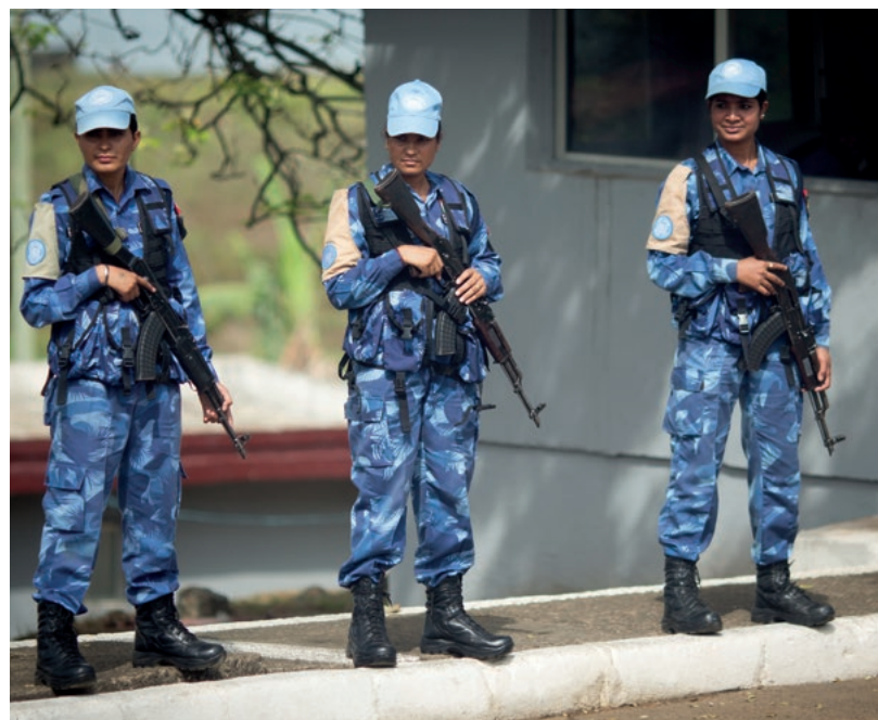
Soldatinnen der Vereinten Nationen stehen in Monrovia, Liberia, am Eingang des Außenministeriums, 10.04.2015