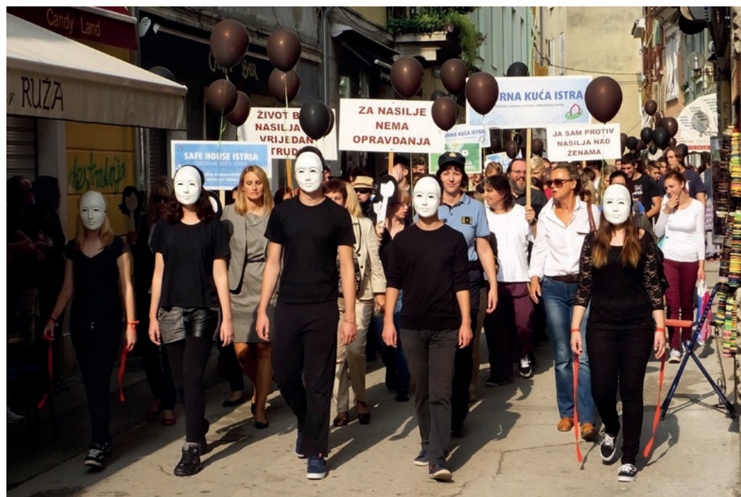
Ein Zug hunderter Bürger anlässlich des Nationalen Tags für die Beseitigung der Gewalt gegen Frauen vermittelte laut und deutlich seine Botschaft: Gewalt hat keine Berechtigung, Pula, Kroatien, 22.09.2014