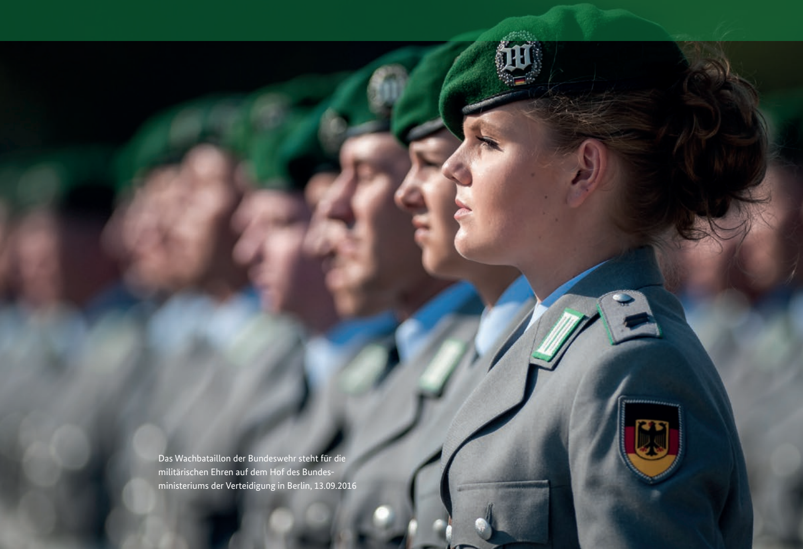
Das Wachbataillon der Bundeswehr steht für die militärischen Ehren auf dem Hof des Bundesministeriums der Verteidigung in Berlin, 13.09.2016

2 Die Mitwirkung von Frauen in allen Phasen und auf allen Ebenen der Konfliktprävention, der Konfliktbeilegung, der Stabilisierung, der Friedensbildung, des Wiederaufbaus, der Nachsorge und der Friedenskonsolidierung ausbauen und ihre Führungsrolle stärken.